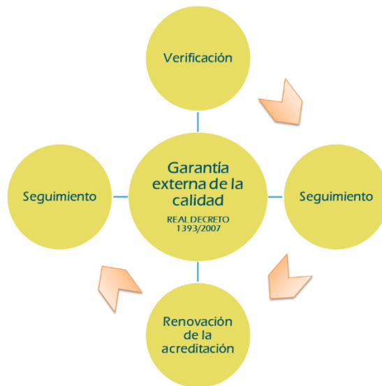
Figura 1.- Ciclo de evaluación externa de las titulaciones oficiales

De esta forma, la mayor autonomía de las universidades en el diseño de sus títulos se combina con un sistema de evaluación, seguimiento y acreditación que permite obtener indicios claros de la implantación efectiva de las enseñanzas contribuyendo a la rendición de cuentas de la institución universitaria.