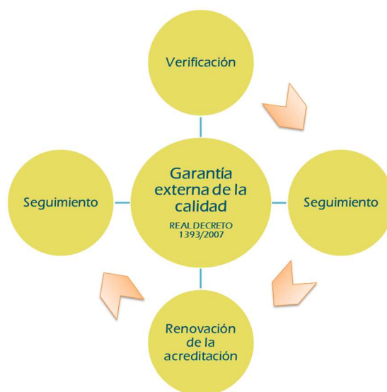
Figura 1.- Ciclo de evaluación externa de las titulaciones oficiales

Las titulaciones oficiales universitarias en España están sujetas a un proceso de evaluación externa estructurado en tres fases: la evaluación ex-ante o verificación (Programa VERIFICA de ANECA), el seguimiento (Programa de Seguimiento de ACPUA) y la evaluación ex-post o renovación de la acreditación (Programa ACPUA de renovación de la acreditación), en las que fundamentalmente están implicados diversos agentes institucionales (Consejo de Universidades, Agencias de evaluación, etc.). Estas fases se corresponden respectivamente con 3 estadios en la vida de un plan de estudios: el diseño del mismo, su desarrollo o implantación y la revisión de sus resultados, en los que el protagonista principal es la universidad.